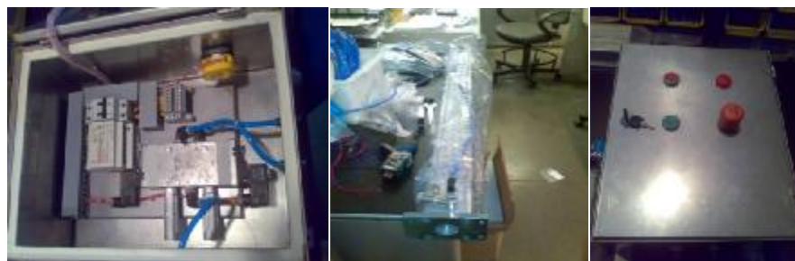
7- برنامه نویسی سیستم کنترل دستگاه تولید بطری (PET) به وسیله کنترل کننده فستو شرکت آب معدنی نوا